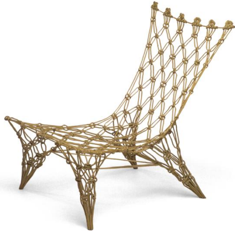
Marcel Wanders, Knotted Chair (prototype no. 5), 1995-1996, Collectie Stedelijk Museum Amsterdam.

Marcel Wanders werd beroemd met zijn ontwerp van de Knotted Chair (1995-1996) - onder andere aangekocht door het Stedelijk en het MoMA - voor het ontwerpplatform Droog. Droog is opgericht om Nederlandse ontwerpers van Dutch Design* in het buitenland te promoten. Wie met Droog samenwerkt, maakt vaak functionele ontwerpen die tegelijkertijd een commentaar vormen op de hedendaagse cultuur. Wanders past helemaal in deze lijn, met zijn nadruk op het persoonlijke en de gevoelswaarde van een object. Zoals de ontwerper in de uitzending zelf aangeeft, is 'vorm versus functie' een van de grote dogma's* in design.