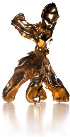
Marcel Wanders, One Minute Sculpture , 2004.