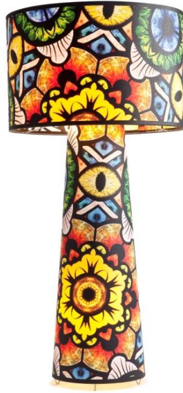
Marcel Wanders, Eye Shadow , 2013.